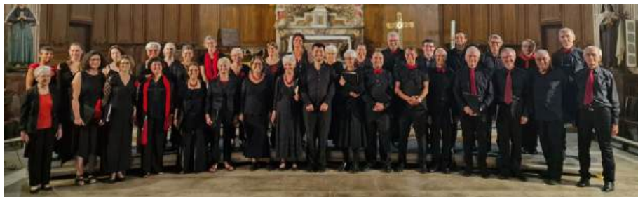
Concert à St-Felix de Lauragais à l'invitation de l'association culturelle du village, 2023