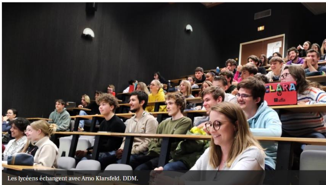
Les lycéens échantent avec Arno Klarsfeld.